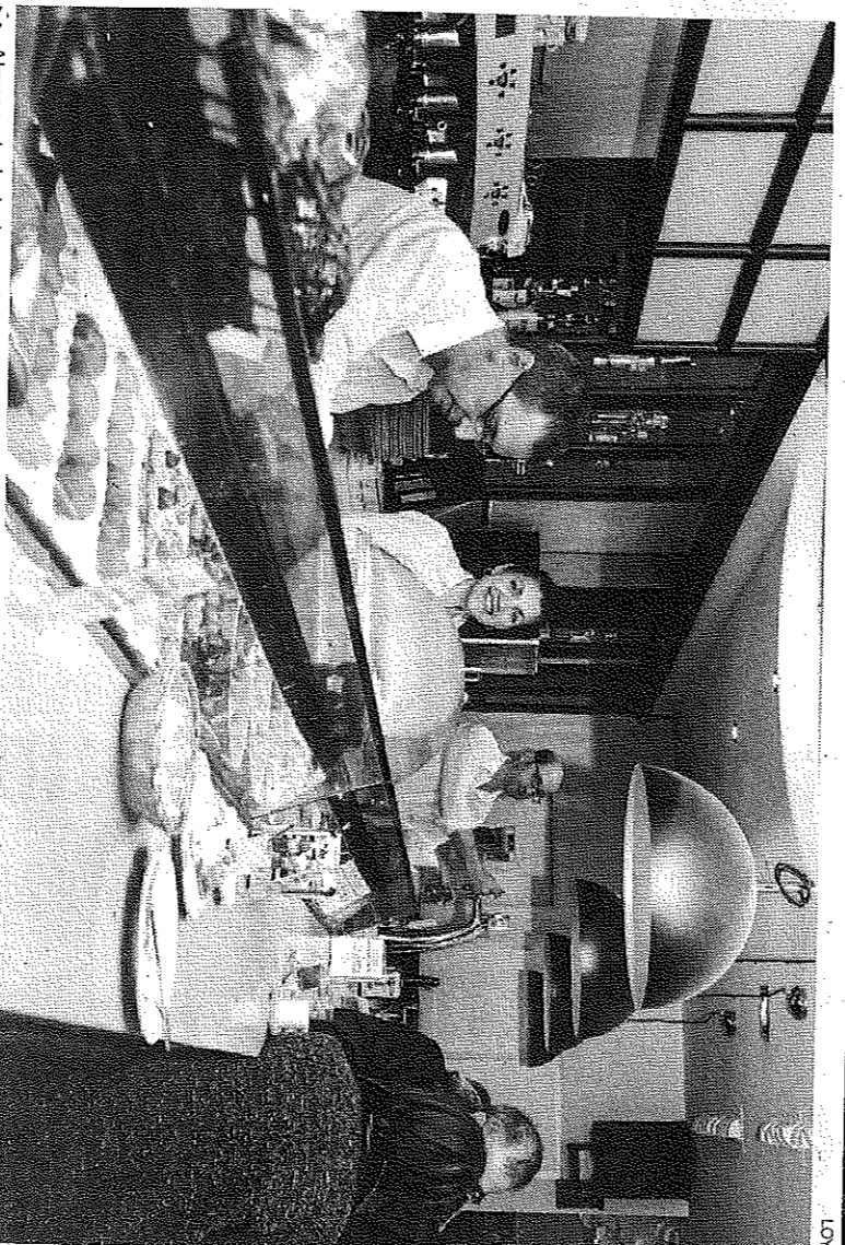
Algunos trabajadores del restaurante puesto en marcha por la Fundación DFA.

En Dfabula se respira aire de integración total, es una parte de Fundación DFA, un lugar en el que se quiere acercar la música en vivo y las actividades lúdicas a personas con discapacidad